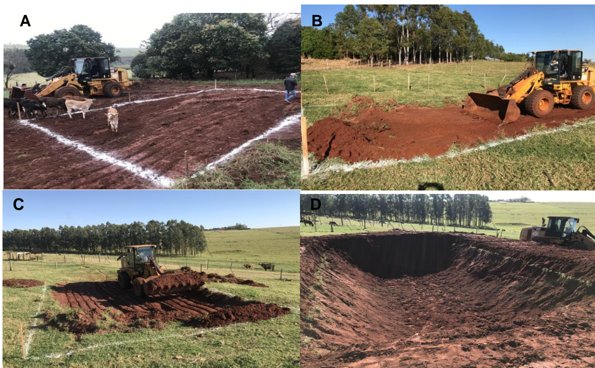
Figura 2 – Construção da esterqueira. (A) marcação do terreno através de esquadramento simples com cal; (B) início da escavação da área; (C) escavação de um buraco no solo com reto escavadeira e pá carregadeira; (D) escavação concluída.