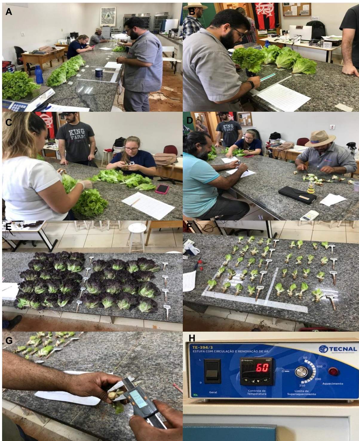
Figura 7 – Avaliação do experimento. (A) pesagem da parte aérea; (B) aferição de diâmetro de cabeça; (C) contagem do número de folhas; (D, G) aferição de diâmetro do caule; (E, F) variedades Carmin e Milena; (H) secagem de folhas frescas em estufa com circulação e renovação do ar a 60° C.