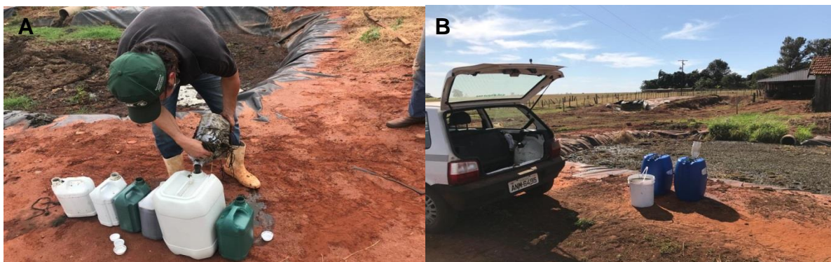
Figura 5 – Coleta do chorume

A análise físico-química do chorume foi realizada em laboratório idôneo (Tabela 5).