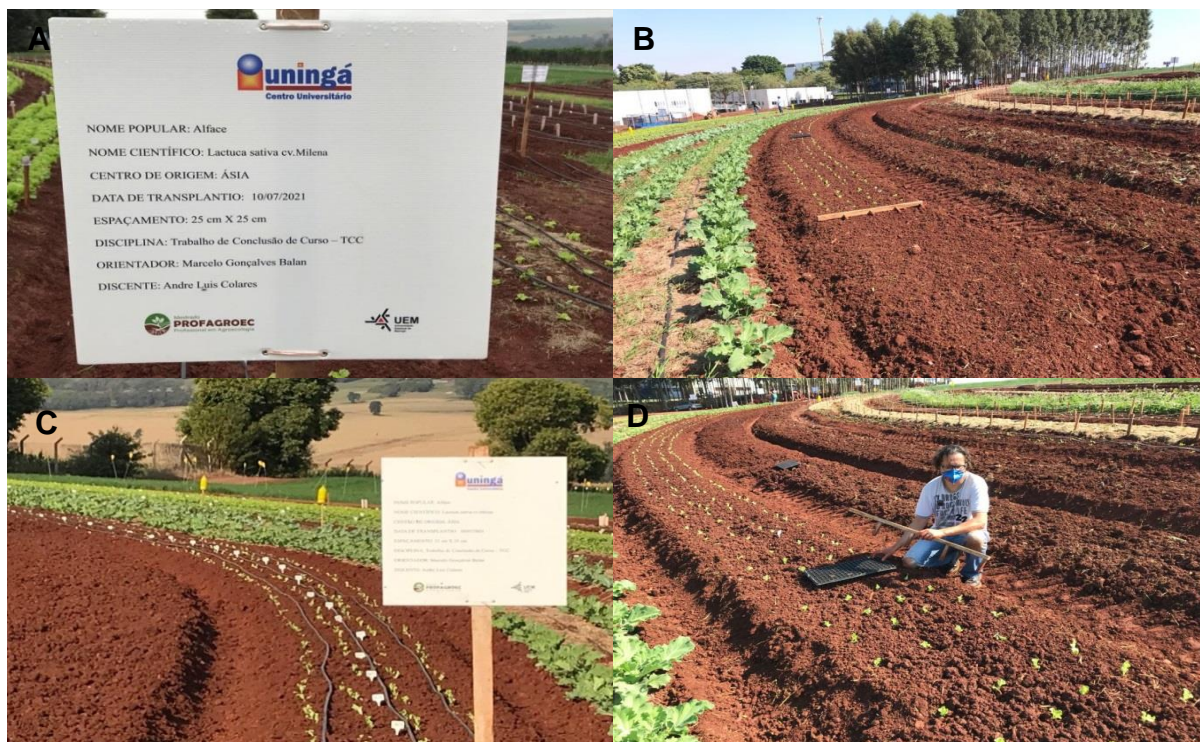
Figura 6 – (A) localização do experimento; (B,C,D) transplântio.