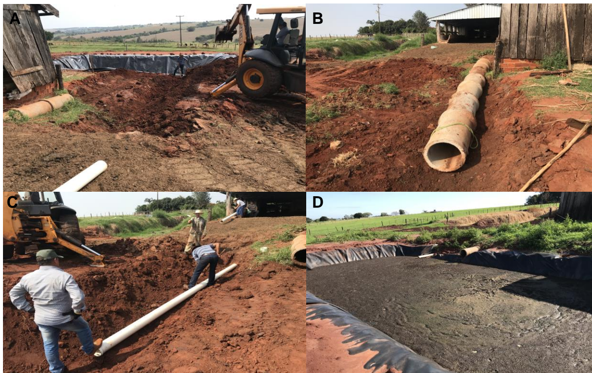
Figura 4 – (A, B, C) disposição dos tubos para entrada dos dejetos e saída do biofertilizante. (D) esterqueira finalizada com demonstração da fixação do perímetro da manta plástica, enterrando-a.

Uma vez finalizada a construção da esterqueira (Figura 4-D), os dejetos oriundos da sala de ordenha caem diretamente nesta por gravidade. O tempo necessário para estar completamente cheia é de aproximadamente dois meses, que no caso desta propriedade foi utilizada para a adubação das pastagens. Como o principal objetivo do trabalho foi a avaliação de um experimento com a alfaca conduzido no Centro Universitário Ingá – UNINGÁ – Maringá-PR, o chorume proveniente desta esterqueira foi coletado e encaminhado para esta instituição.